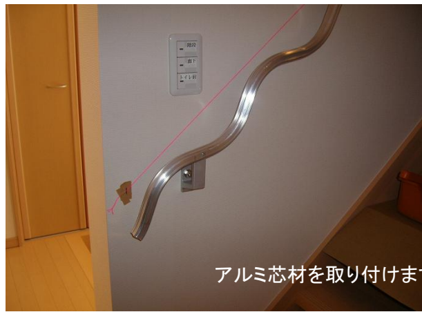
アルミ芯材を取り付けま