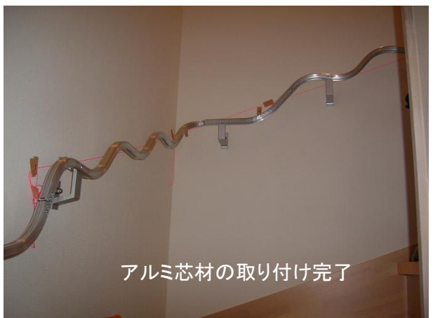
アルミ芯材の取り付け完了