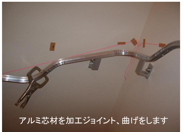
アルミ芯材を加工ジョイント、曲げをします