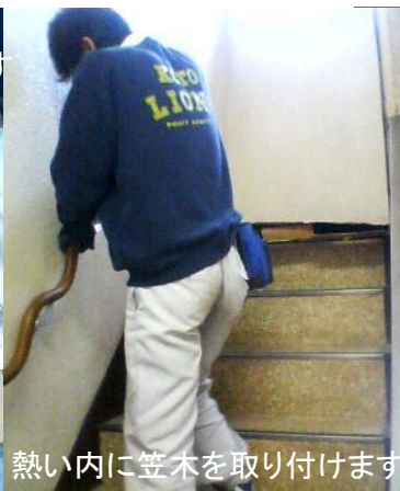
熱い内に笠木を取り付けます