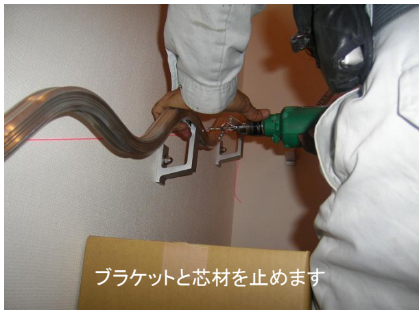
ブラケットと芯材を止めます