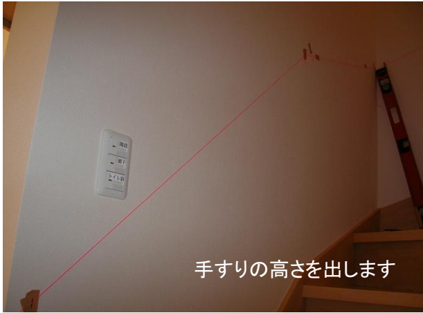
手すりの高さを出します