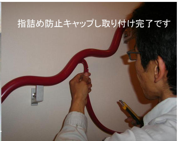
指詰め防止キャップし取り付け完了です