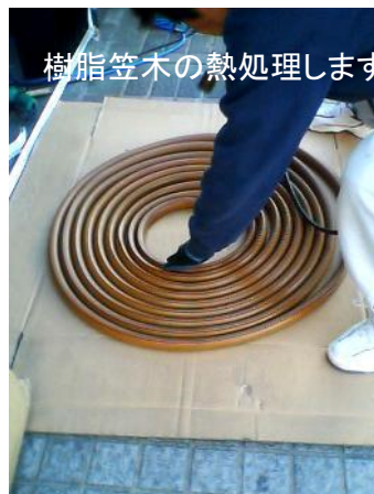
樹脂笠木の熱処理します